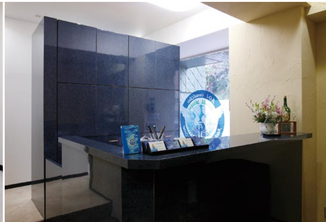
受付カウンターでは笑顔のスタッフに迎えられる。